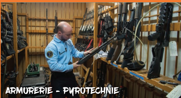
ARMURERIE - PYROTECHNIE